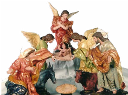
Belen Artesanía Mirete. Nacimiento Salzillo.