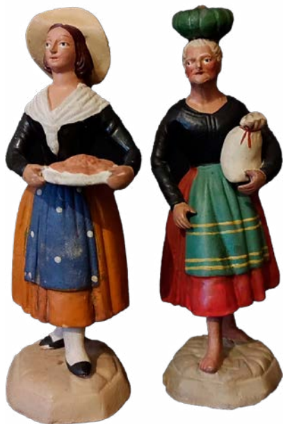
Figura popular murciana.

Los actuales artesanos del belén murcianos son los herederos y mantenedores de una antigua tradición que, de manera incipiente, estaba ya presente en la ciudad de Murcia en el siglo XVII y que, en el siglo XVIII, el escultor murciano Francisco Salzillo , con su monumental belén (1727-1746), elevó a la máxima expresión del belén en España, con figuras, que son esculturas completas, dotadas de una gran expresividad (el rostro, las manos, el plegado de las vestimentas, etc.), movimiento, religiosidad, barroquismo y realismo, en el que, con la recreación de escenas evangélicas, costumbristas y populares, muestra el ambiente murciano de la época.