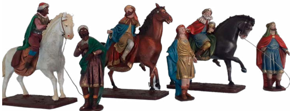
Artesanía Serrano. Reyes Magos y pajes.