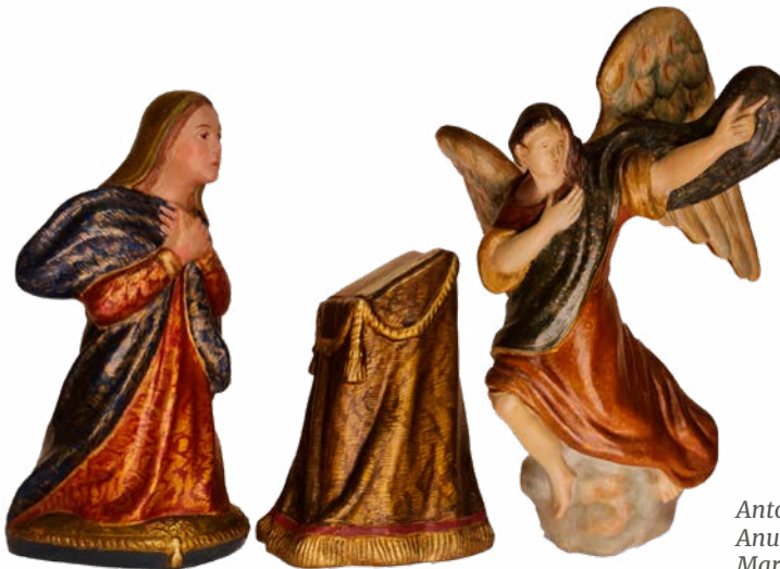
Antonio Garrigós. Anunciación a María.

Los Bellos Oficios de Levante: taller creado en 1923 por Antonio Garrigós y Clemente Cantos, en el Paseo de Corvera, dedicado a la realización de pequeñas figuras de barro de temática costumbrista y popular y figuras de belén con una policromía fina y delicada imitando el estofado de las esculturas barrocas.