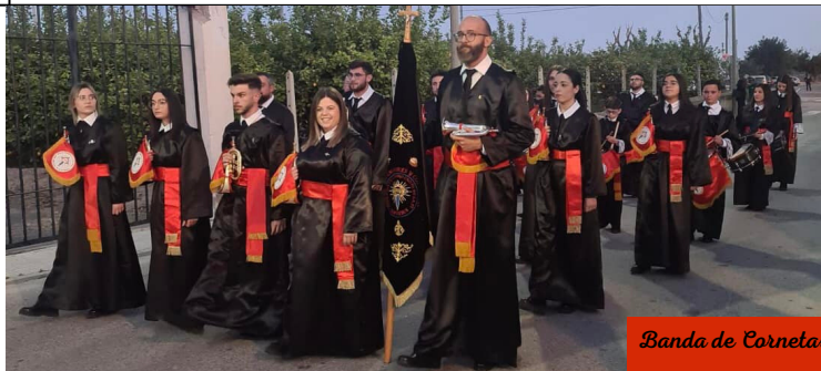
Banda de Cornetas y Tambores

C/ DE LA IGLESIA - CRTA A FUENTE ÁLAMO - C/ ALJIBES - C/ CARRASCOY - C/ PASEO DE MURCIA - C/ TORVERO JUAN PEÑALVER - CRUZA CRTA FUENTE ÁLAMO HACIA C/ 2 DE MAYO - C/ MAYOR - C/ JUAN CARLOS I - C/ PÁRROCO ANTONIO PUJANTE - REFUGIO IGLESIA